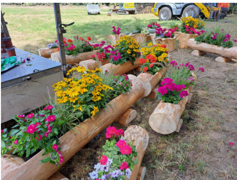
Bild unten: Blumentröge erstellt vom Personal des Forstbetriebs Mutschellen.

Bild Oben: Blockhaus erstellt am Lehrlingskurs mit Instruktor Christoph Schmid.